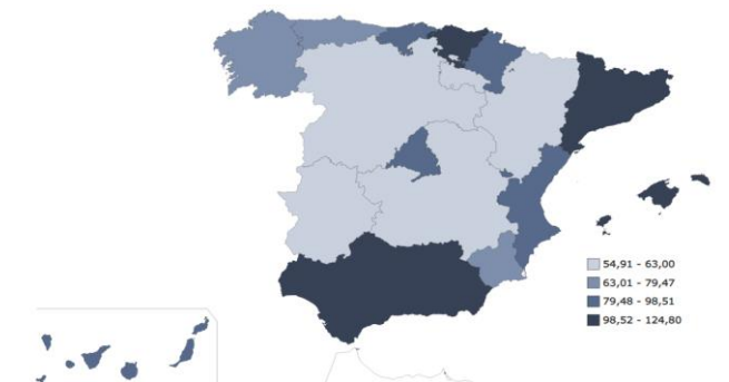
Tarifa media diaria (ADR) Nacional y CCAA. Julio 2019

La Comunitat Valenciana és el segon destí dels viatgers residents a Espanya (14,9%) i el quint destí dels viatgers no residents (5,1%).