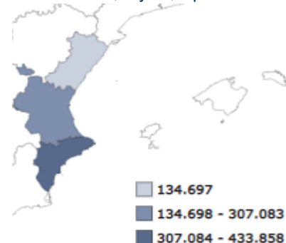
EOH. Provincias, Viajeros, Septiembre 2018