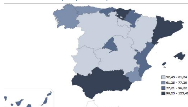
Tarifa media diaria (ADR) Nacional y CCAA. Julio 2018

La Comunitat Valenciana es la cuarta autonomía, en cuanto al grado de ocupación de plazas hoteleras (74,0%).